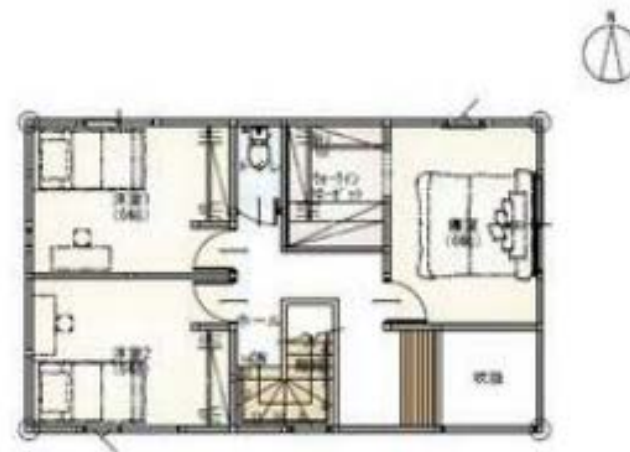
2階 平面図 5:1/100

石川県知事免許(1)第4520号 〒920-0363 石川県金沢市古府町南892番地3